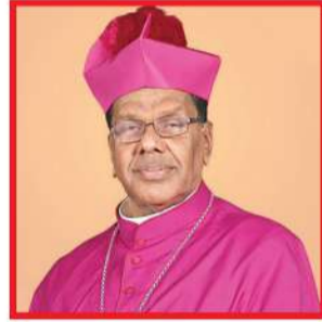
முழுமையான சுற்றுமடலை பக்கம் 03 இல் காண்க

என்பது உணவு மட்டுமல்ல, அது பாவச் செயல்களையும் எண்ணங்களையும் விலக்கி, மனத் தூய்மை பெற்று, கடவுளோடு நாம் ஒப்புரவாக உதவுகின்றது. எனது நோன்பு எனது அடுத்திருப்பவனின் பசியைப் போக்க வேண்டும். எம் ஒறுத்தலினால் இல்லாதவர் வாழ்வு பெறவேண்டும். எனவே, இத்தவக்காலத்தில் நற்காரியங்களில் ஈடுபட்டுச் செயலுடன் கூடிய தவ முயற்சியினால் தேவையில் வாழும் எம் சகோதரர்களில் துன்புறும் இயேசுவைக் காண முயல்வோம்.